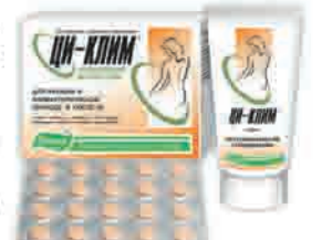
СЗЗ №77.99.03.915.Д.014313.12.07 СоГР №77.99.23.3.У.11623.10.05

Теперь и в российских аптеках появились такие препараты! Это крем и таблетки «ЦИ-КЛИМ» с фитоестрогенами цимицифуги от компании «Эвалар». Для профилактики возрастных изменений их нужно применять с 35 - 40 лет, когда начинает уменьшаться выработка собственных эстрогенов. Доказано: если раз в год в течение 3 - 4 месяцев применять средства с фитоестрогенами, это отсрочит тот день, когда понадобятся более кардинальные способы коррекции возрастных изменений. А с наступлением менопаузы «ЦИ-КЛИМ» должен быть с вами постоянно. «ЦИ-КЛИМ» - Ваше средство управления возрастом, помогающее сохранить молодость, красоту и здоровье.