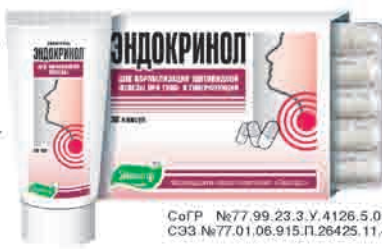
СоГР №77.99.23.3.У.4126.5.08 СЗЗ №77.01.06.915.П.26425.11.4

ЭНДОКРИНОЛ практически не имеет противопоказаний, кроме возможной индивидуальной непереносимости, и его с успехом можно применять всем. С ЭНДОКРИНОЛОМ щитовидка, а значит, и ваше здоровье всегда будет под надежной защитой!