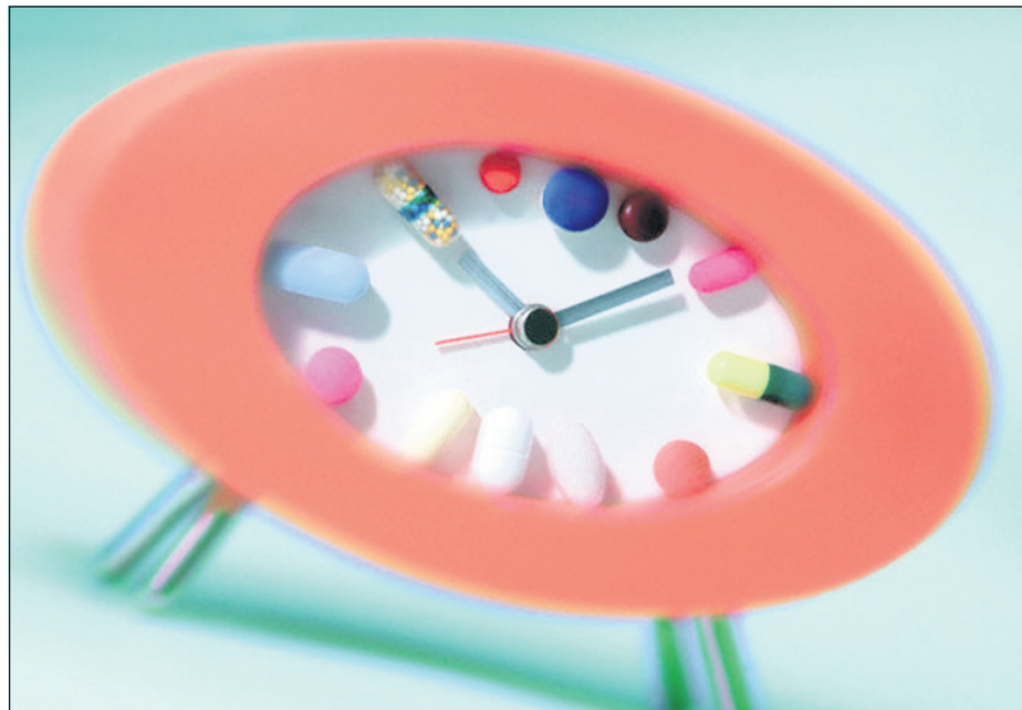
Таблетки принимать лучше строго по расписанию

Антибиотики действуют только на бактерии, вирусы не убивают.