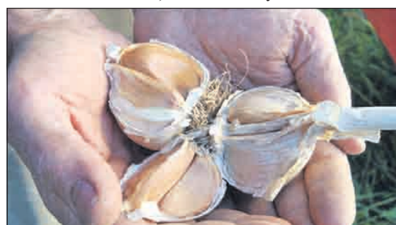
Не знаем, как насчёт вампиров, а вот с болезнями чеснок борется на раз-два-три

● При неврозах сердца, стенокардии, гипертонии, головокружении, слабой памяти, для расширения кровеносных сосудов, при снижении работоспособности, особенно в старческом возрасте, рекомендуется ежедневно употреблять по 2 — 3 зубчика чеснока.