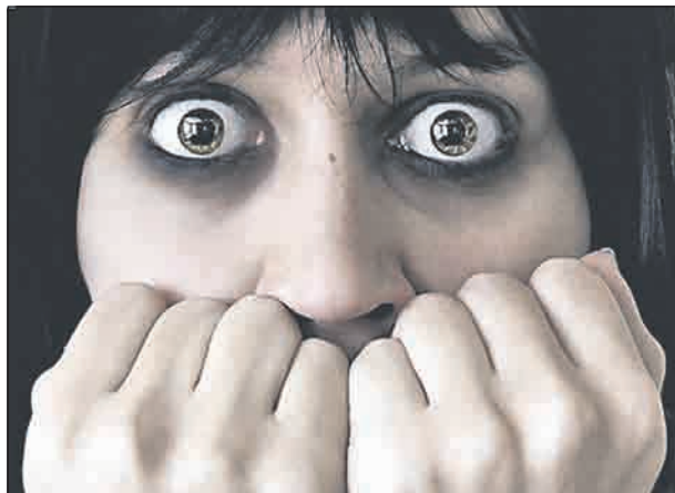
Глаза — зеркало души, а лицо — зеркало тела

Область между бровями. Покраснения, шелушения здесь могут говорить об отклонениях в работе печени. Ещё один при-